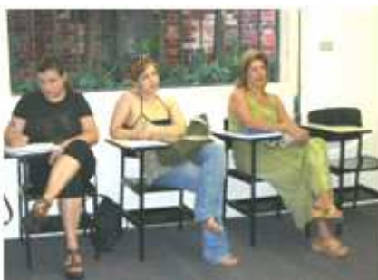
Professores em curso da Alumni