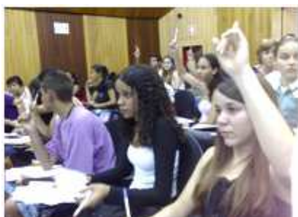
Alunos em seleção na Alumni

Nosso mais novo Parceiro para o trabalho em Rede é a Intermédica Saúde – que desenvolverá ações preventivas em Saúde por meio de palestras aos jovens e à comunidade escolar, inicialmente em duas escolas parceiras.