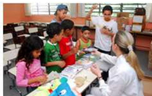
Intermédica na Escola Travassos